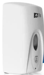
Art. AU3GA100P0 12,3x12x26,5 cm

Dispenser non incluso - Dispenser not included