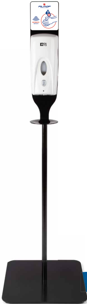
Art. AU3KA100V7 40x40x135,5 cm

Dispenser non incluso - Dispenser not included